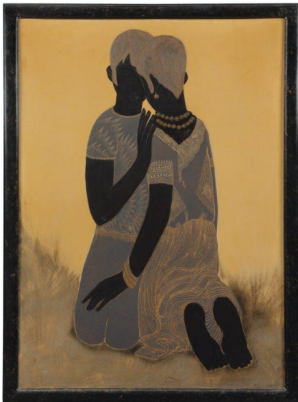
Dunand Jean , Deux figures à genoux , 1929