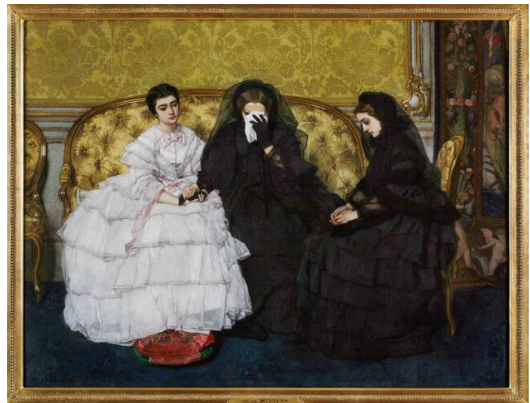
Stevens Alfred , La consolation , 1857- Musée Ixelles-Belgique