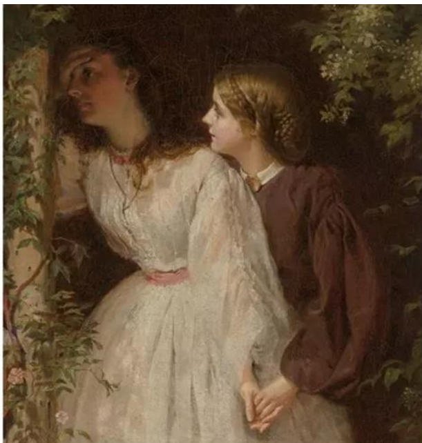
consolation des deux sœurs , 1864