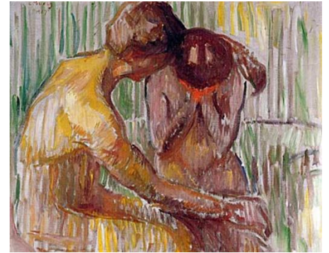
Munch Edvar , Consolation , 1907, Musée Munch-Oslo