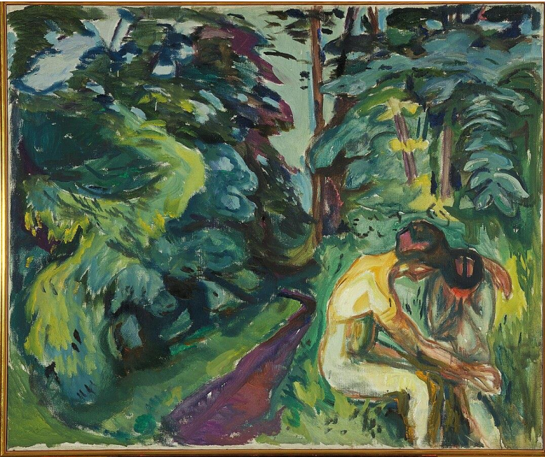
Munch Edvar , Consolation dans la forêt , 1924, Musée Munch-Oslo